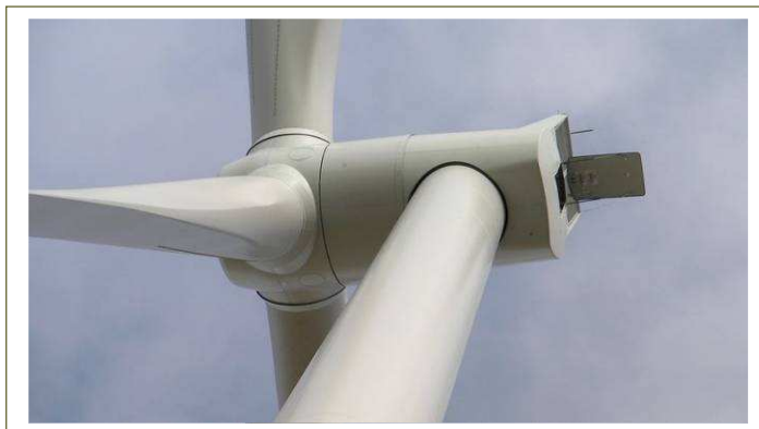
une nacelle de SWT113-3.0 Siemens près de Lille