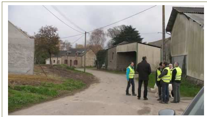
L'équipe de Siemens et EOLA étudie les accès au site

Les AG des clubs devront être programmées entre le 27 mars et le 10 avril pour soumettre ces propositions aux votes des adhérents. Ils devront également, s'il y a lieu, valider l'entrée des nouveaux membres ainsi que la sortie de ceux qui sont partis pour créer de nouveaux clubs, et les modifications éventuelles de la structure du club (changement de gérant ou de trésorier).