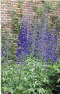
Fougères (en haut) et pieds d'alouette (en bas)