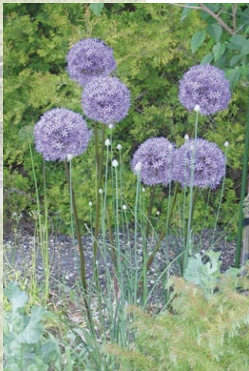
Pieds d'ail d'ornement