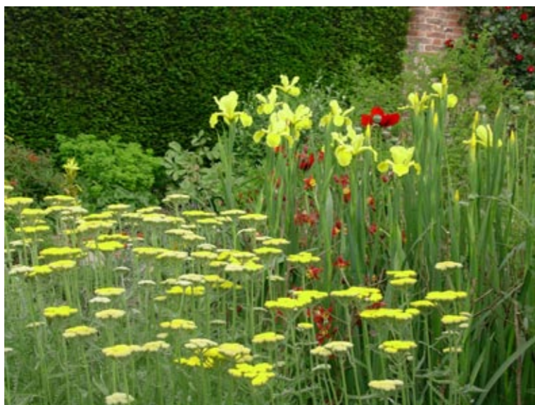
Les associations de couleurs peuvent donner des effets réussis : ici achillées et iris jaunes se mêlent à quelques touches légères d'ancolies et de pavots pourpres.