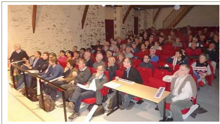
AG 2017 de la SAS EOLA au théâtre de Teillé

Le rapport est disponible sur le site de l'ANSES, sa synthèse sur le site d'Eola, page Documentation