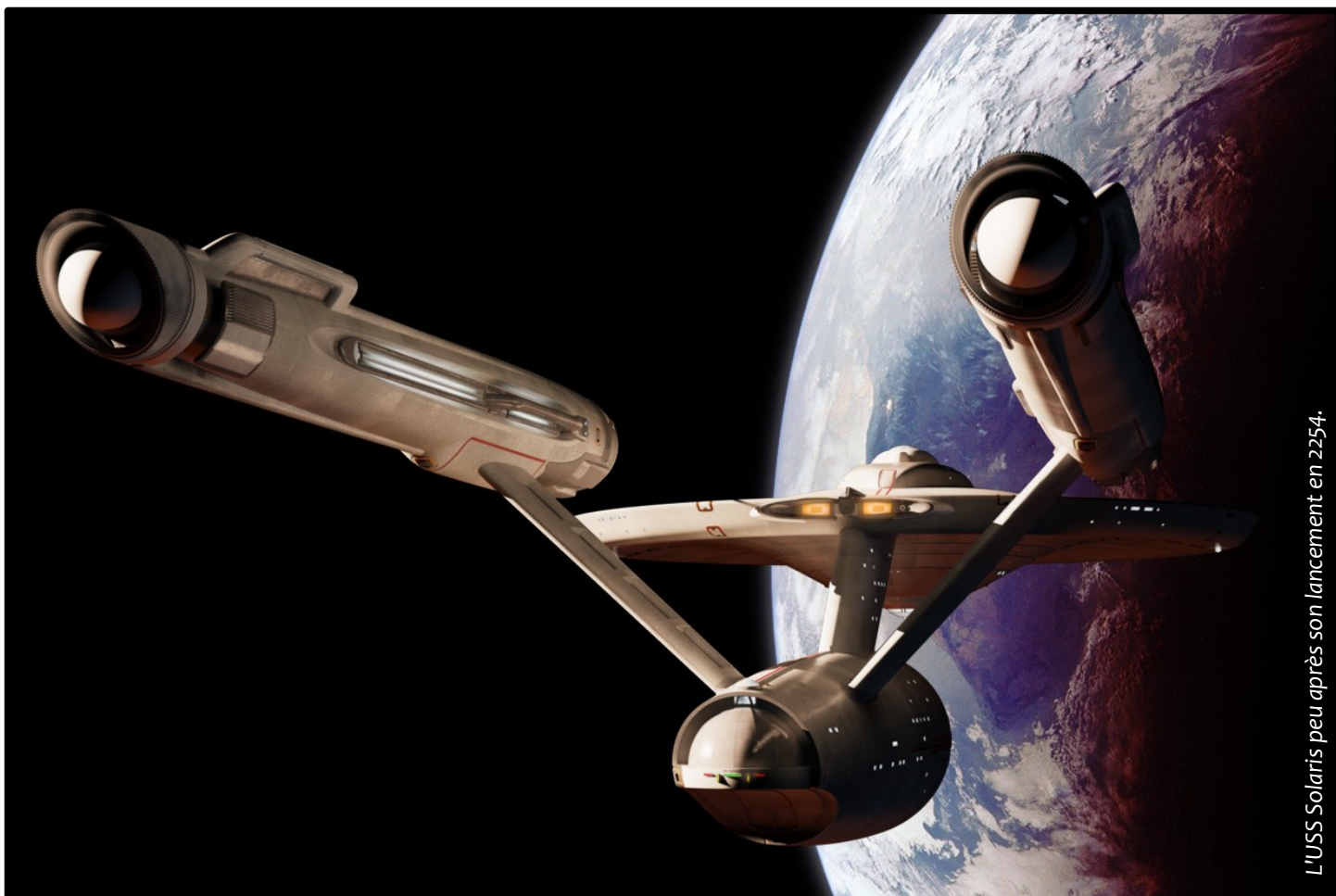
L'USS Solaris peu après son lancement en 2254.