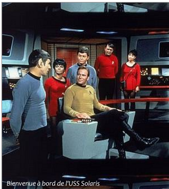
Bienvenue à bord de l'USS Solaris

Votre personnage est prêt pour l'aventure.