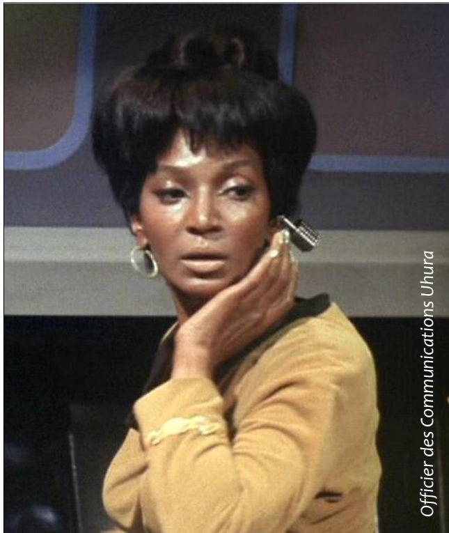
Officier des Communications Uhura

L'équipement de base d'un officier des communications est un uniforme jaune et un communicateur.