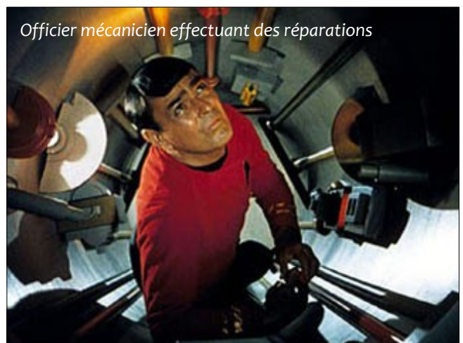
Officier mécanicien effectuant des réparations

Les compétences de base d'un officier mécanicien sont: Connaissances (choisissez deux domaines), Construire/réparer, Ingénierie, Ordinateur, Piloter, Technologie.